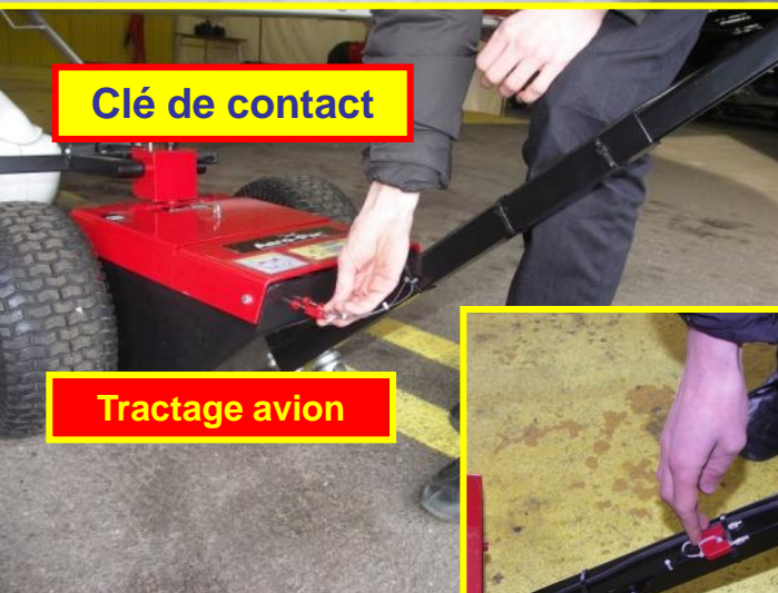
Clé de contact