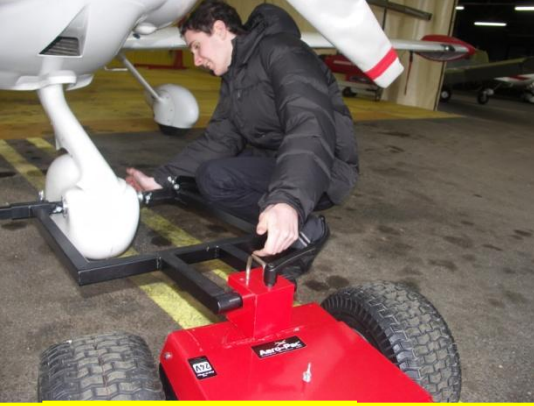
Mise en place sur avion